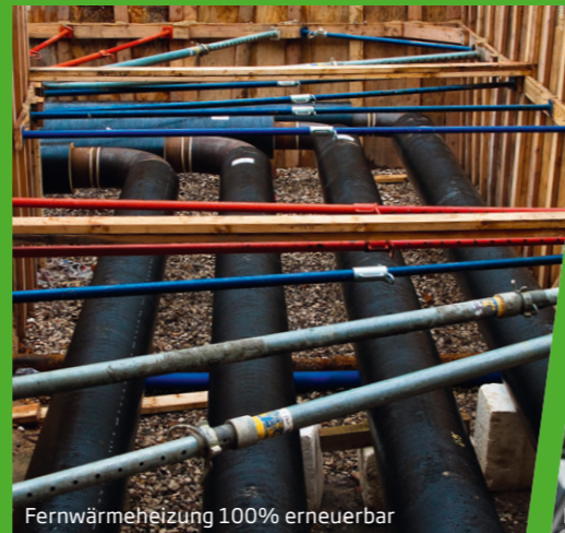
Fernwärmeheizung 100% erneuerbar