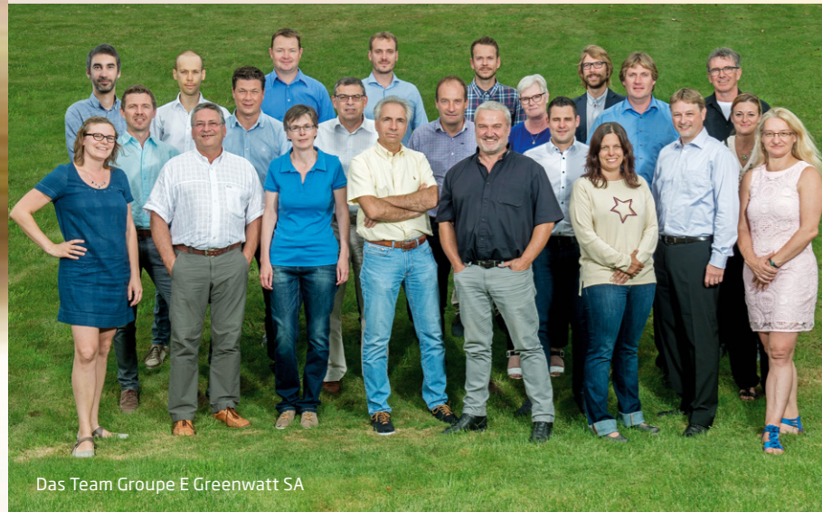
Das Team Groupe E Greenwatt SA