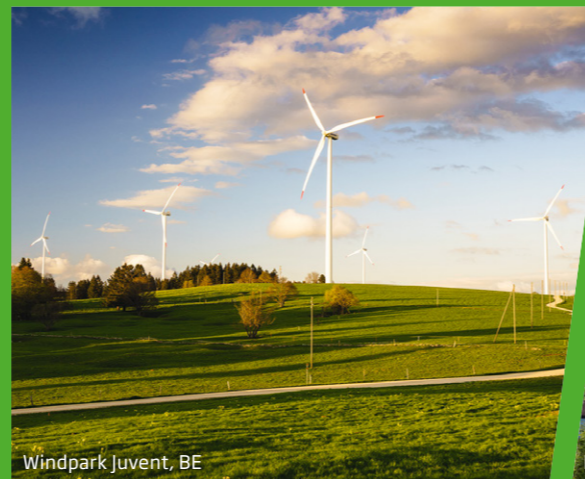
Windpark Juvent, BE