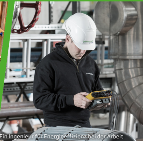
Ein Ingenieur für Energieeffizienz bei der Arbeit