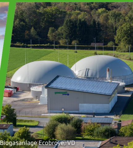
Biogasanlage Ecobroye, VD