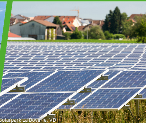
Solarpark La Boverie, VD