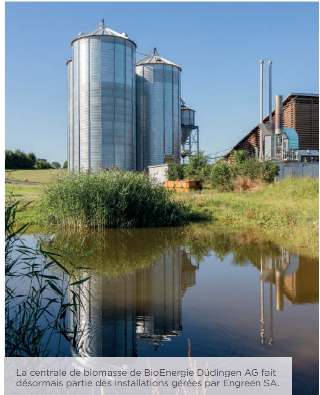
La centrale de biomasse de BioEnergie Düdingen AG fait désormais partie des installations gérées par Engreen SA.