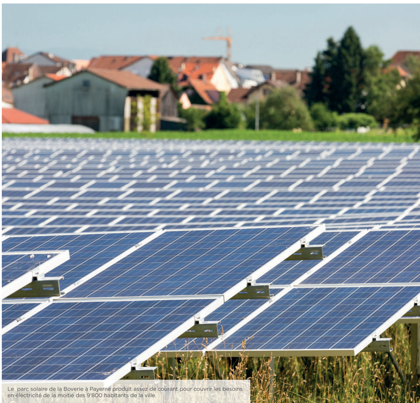
Le parc solaire de la Boverie à Payerne produit assez de courant pour couvrir les besoins en électricité de la moitié des 9'800 habitants de la ville.

La succursale fribourgeoise de la fiduciaire BDO SA a assumé ce mandat pour l'exercice 2020.