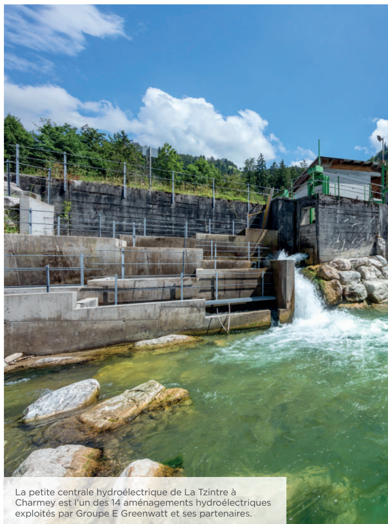
La petite centrale hydroélectrique de La Tzintre à Charmey est l'un des 14 aménagements hydroélectriques exploités par Groupe E Greenwatt et ses partenaires.

Durant l'exercice 2020, le Conseil d'administration s'est réuni à trois reprises.