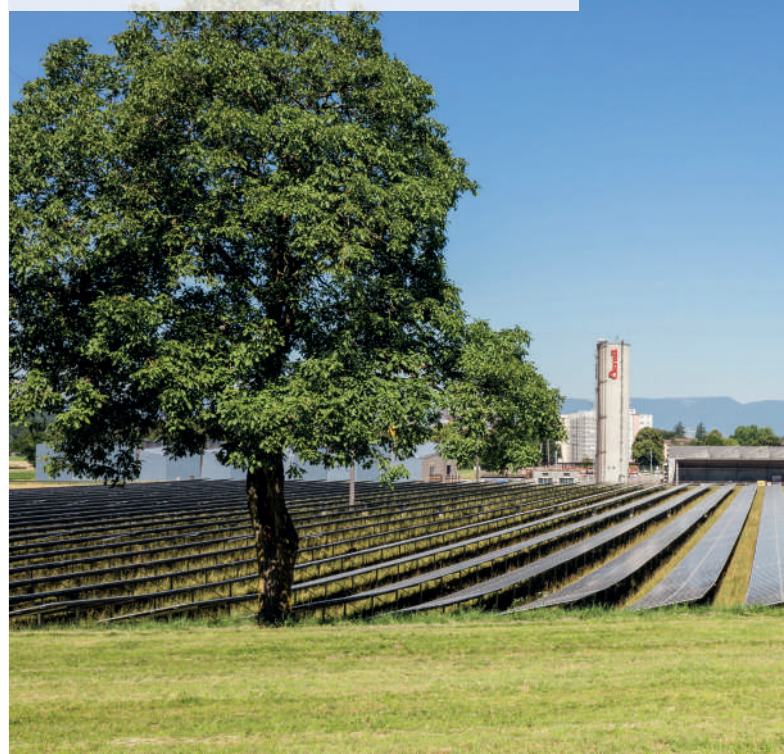
Les panneaux photovoltaïques du parc solaire de la Boverie couvrent une surface totale de 38'000 m 2 .