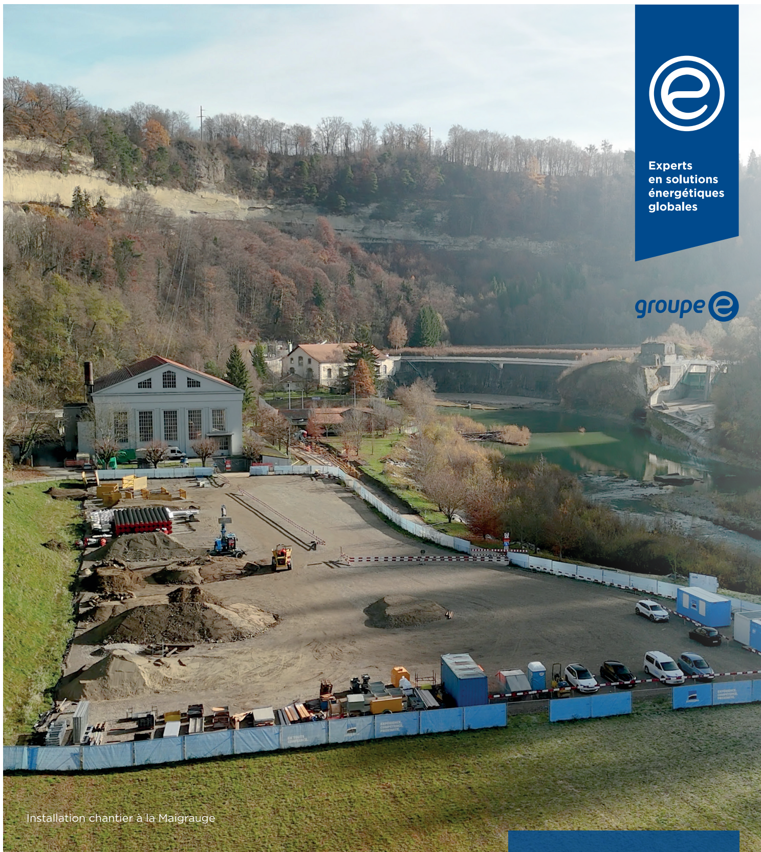
Installation chantier à la Maigrauge