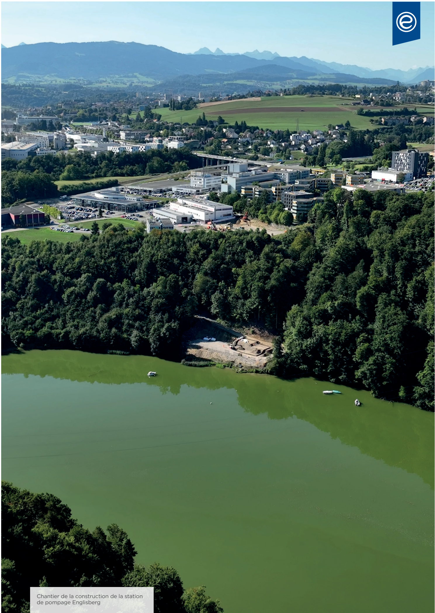
Chantier de la construction de la station de pompage Englisberg